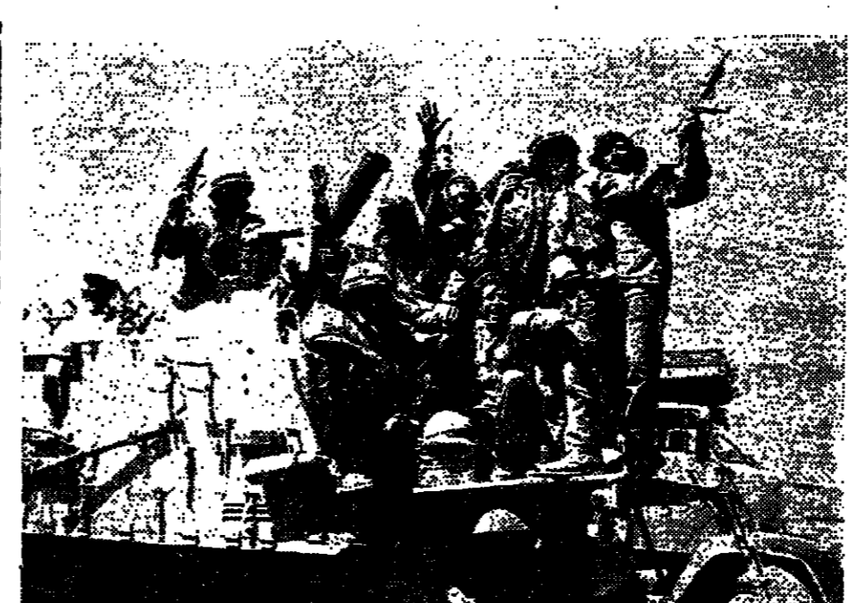
שמה בקרב הימים בעלות על השכם והתערה